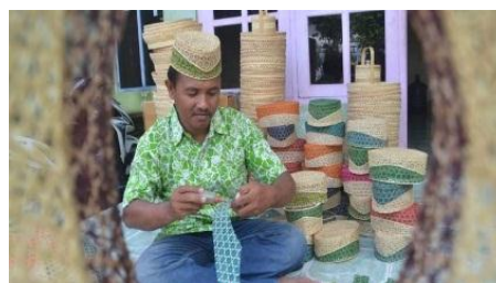
Gambar 1. Produk Songkok Bambu Desa Gintangan, Kec. Blimbingsari – Banyuwangi

produk songkok bambu memiliki banyak peminat yang berdampak pada meningkatnya ekonomi kreatif desa secara berkelanjutan. Potensi ini sejalan beriringan antara industri kreatif dengan ekonomi kreatif. Korelasi ekonomi kreatif beranjak pada proses pembuatan produk yang tersistem dengan baik oleh pengrajin dan untuk industri kreatif berprioritas pada proses berbisnis agar dikenal manca negara sebagai sentra kerajinan yang menumbuhkan kemajuan ekonomi masyarakat.