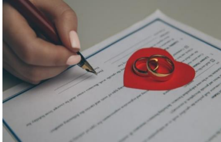
Gambar 1. Mengetahui Perjanjian Perkawinan Di Indonesia